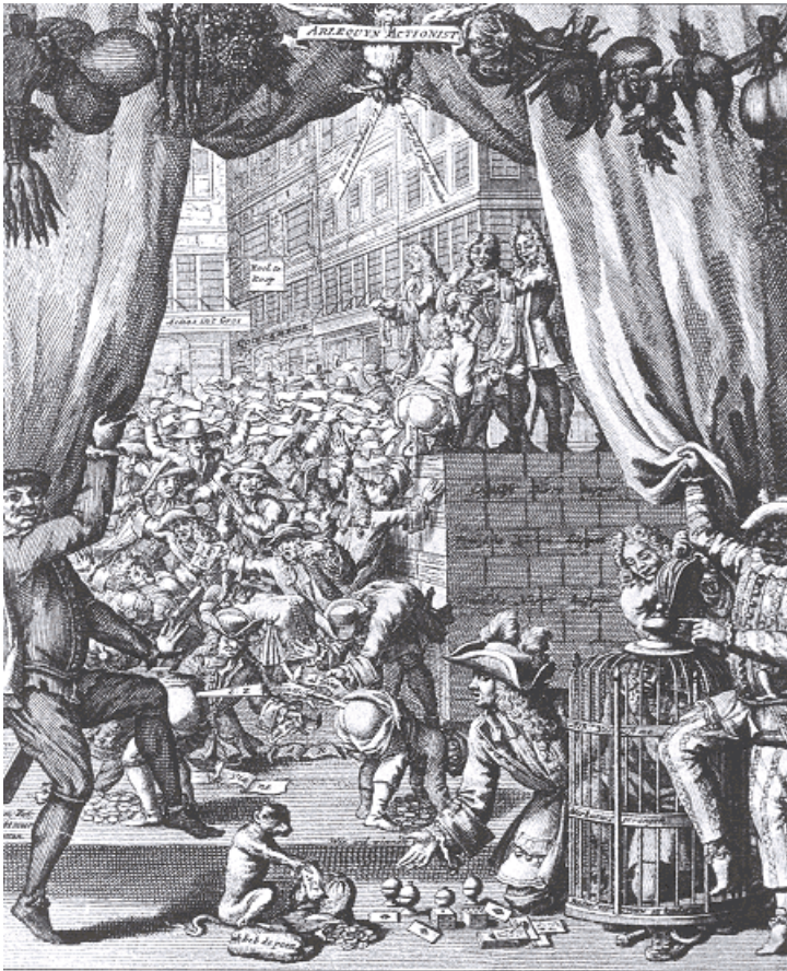
Titelillustratie bij Langendijks Arlequyn Actionist , 1720

volgen - behelst een klucht de voorvallen van ‘gemeene personen’, terwijl bij een blijspel ernstiger taal gebruikt wordt, omdat zich daar ‘hevige hartstochten van liefde en haat onder personen van staat opdoen’.