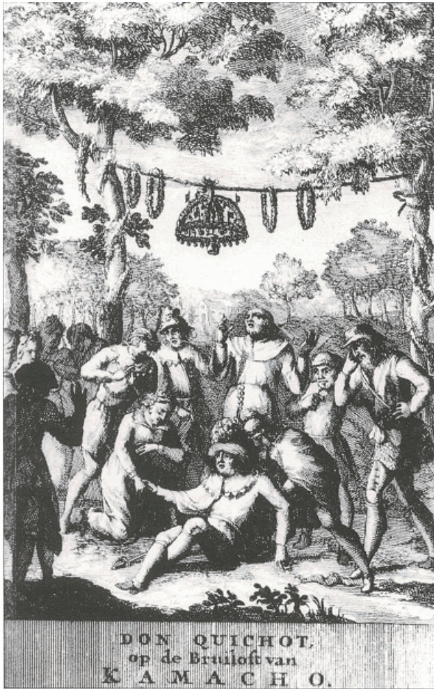
Titelpagina van Pieter Langendijks Don Quichot op de bruiloft van Kamacho , 1712.